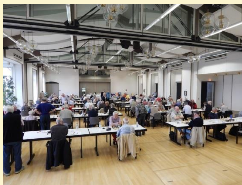
Blick über den Turniersaal