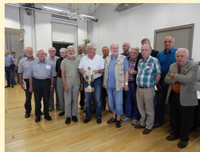
Alle Preisträger des Turniers 2013 versammelt zur Siegerehrung